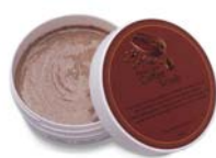
PERFECT SKIN COFFEE SCRUB