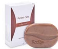
PERFECT CARE COFFEE SOAP