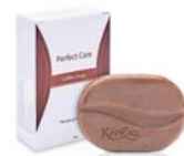
PERFECT CARE COFFEE SOAP